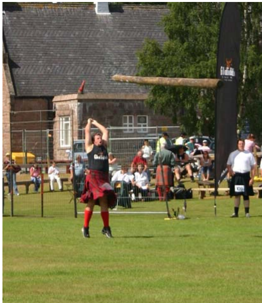
Lancé de tronc d'arbre