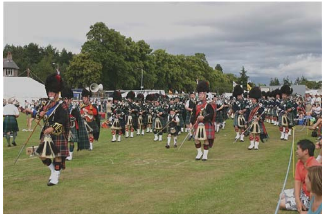
Défiler de musiciens